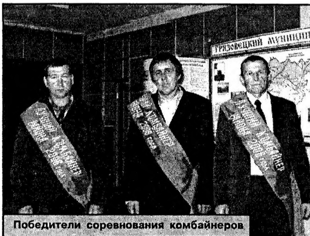
Победители соревнования комбайнеров

За последние 5 лет много сделано в техническом оснащении. 20% молока производится на новом доильном оборудовании. Приобретен 21 раздатчик-смеситель, они обеспечивают кормление