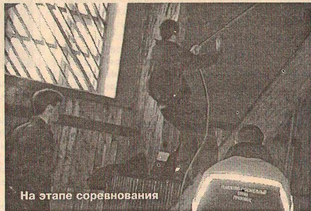
На этапе соревнования

Вторая эстафета - комбинированная - потребовала