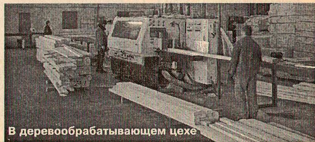
В деревообрабатывающем цехе