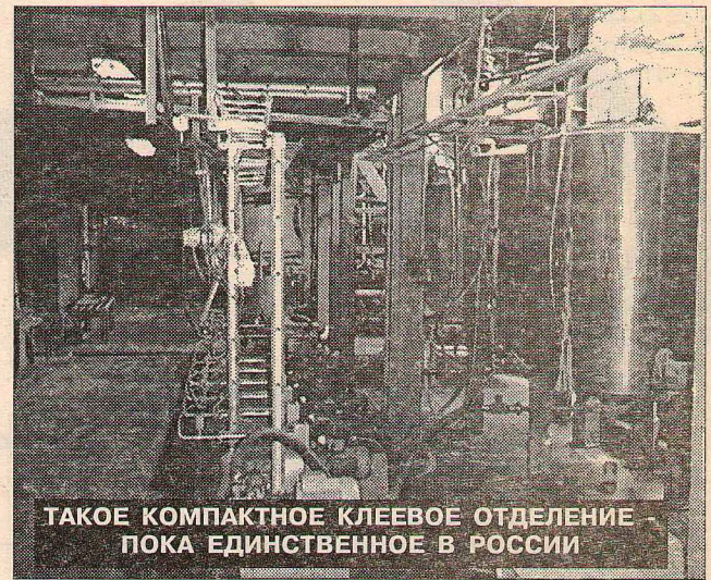
ТАКОЕ КОМПАКТНОЕ КЛЕЕВОЕ ОТДЕЛЕНИЕ ПОКА ЕДИНСТВЕННОЕ В РОССИИ

В цехе ламинирования запускается вторая технологическая линия итальянского производства. Получив ее в апреле, мы остановим в ближайшее время