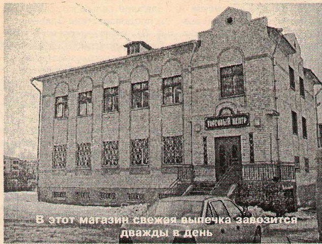
В этот магазин свежая выпечка завозится дважды в день