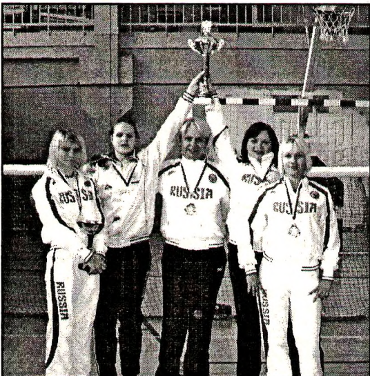
Команда Вологодской области по голболу на Чемпионате России