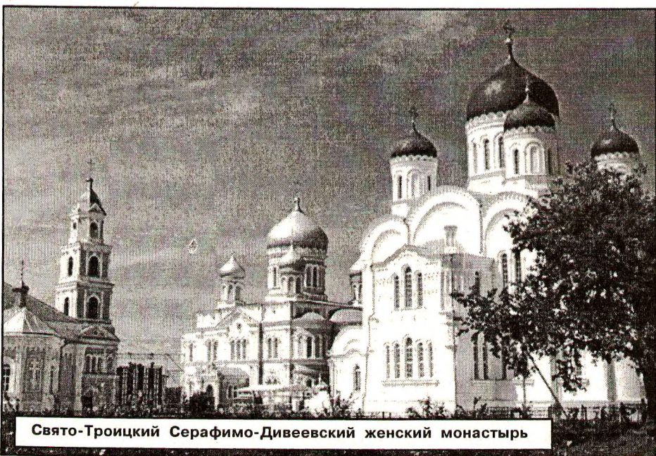
Свято-Троицкий Серафимо-Дивеевский женский монастырь

Среди многих святынь монастыря по-своему выделяется Святая Канавка. Много чудесного говорил о ней батюшка Серафим: «Эта Канавка — до небес высота. Кто Канавку эту с молитвой пройдет да полтора года Богородица прочтает, тому все тут: и Афон, и Иерусалим, и Киев! А как Анти-