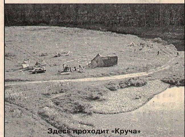
Здесь проходит «Круча»