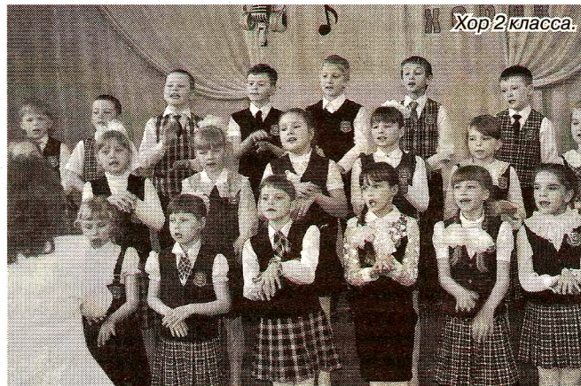
Хор 2 класса.