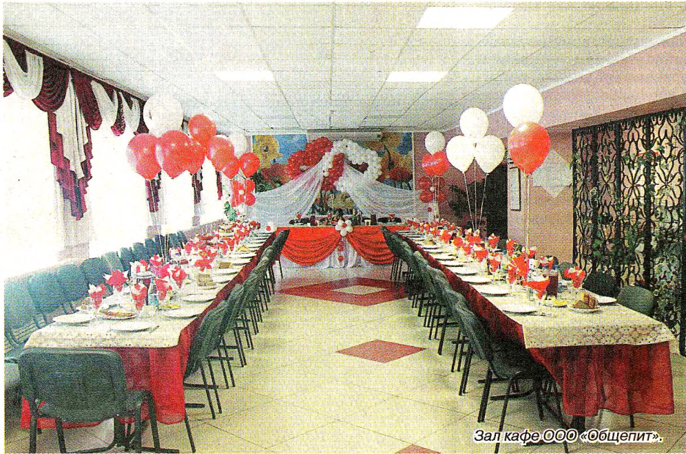
Зал кафе ООО «Общепит».