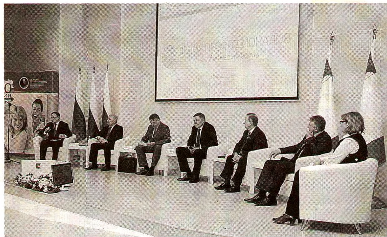
Разработанный Правительством Вологодчины документ экспертное сообщество региона обсудило на прошедшем в областном центре форуме «Время профессионалов».

Необходимость разработки Стратегии следует из принятого в 2014 году Федерального закона «О стратегическом планировании в Российской Федерации». До 1 января 2017 года во всех регионах страны должны быть подготовлены документы стратегического планирования, главным из которых как раз и является стратегия социально-экономического развития. Инициатором разработки Стратегии на Вологодчине сразу после своего избрания на пост Губернатора выступил Олег Кувшинников.