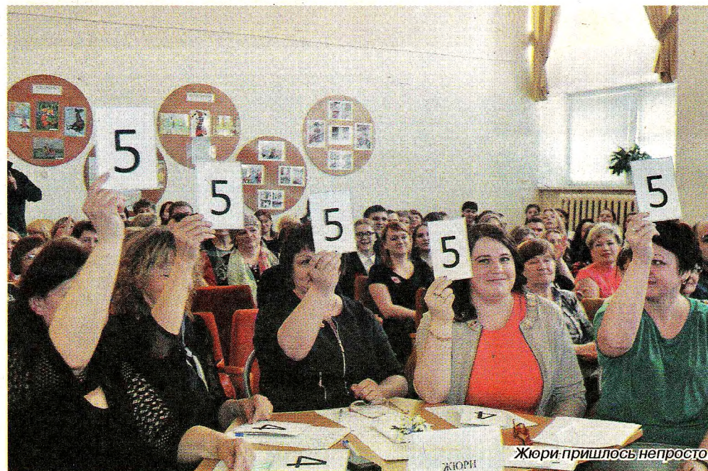
Жюри пришлось непросто.

Патриотические песни никого не оставляют равнодушными. Стоит раздаться звуком одной из них, как у зрителей распрямляются плечи, загораются задорным блеском или наполняются глубоким раздумьем глаза. Участники хоров исполнили песни, в которых