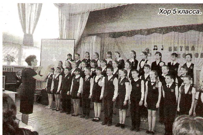
Хор 5 класса.