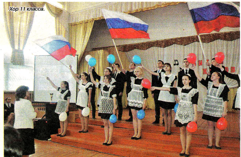
Хор 11 класса.