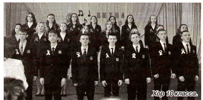
Хор 10 класса.