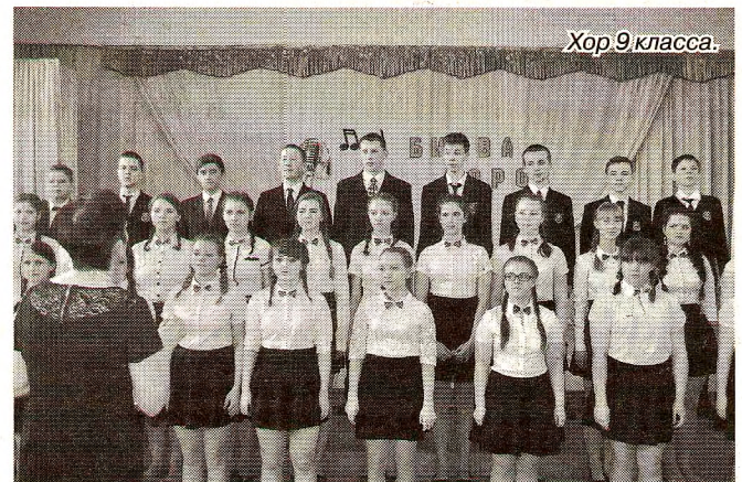
Хор 9 класса.