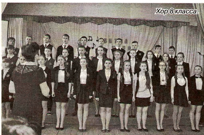
Хор 8 класса.