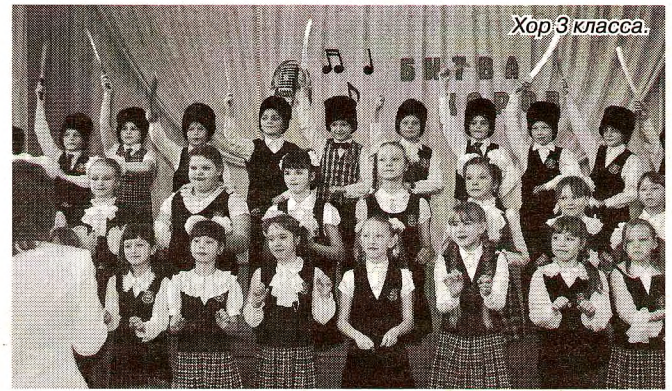
Хор 3 класса.