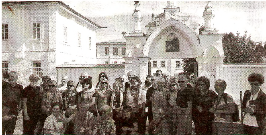
«Bravissimo! Bravissimo!» (с итал. «прекрасно») - такие возгласы звучали от туристов из Италии