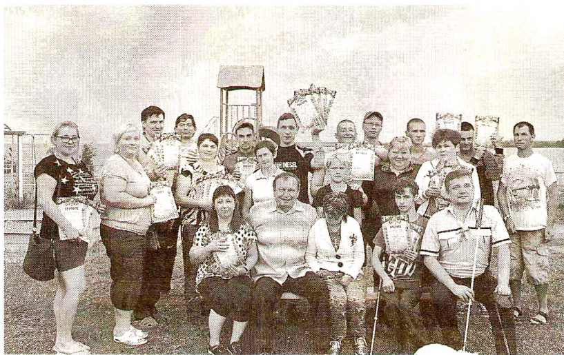
В работе слета приняли участие 20 молодых людей

В рамках слета прошел круглый стол по проблемам молодых инвалидов, участники которого обсудили такие актуальные для них вопросы как получение образования, профессии, трудоустройство, медицинское обслуживание, санаторно-курортное лечение, обеспечение средствами ре-