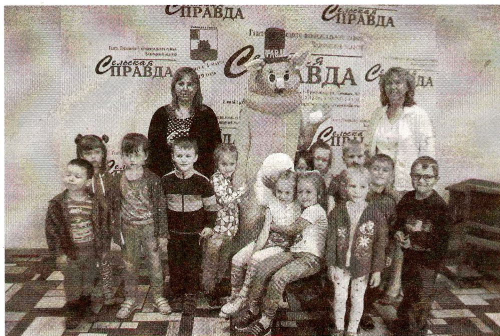
В гостях у Правдика ребята из детского сада «Ивушка»