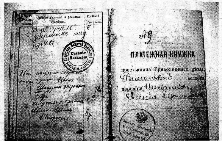
В таблице «наименование сборов» включено:

Передо мной платёжная книжка крестьянина Грязовецкого уезда, Раменской волости, деревни Михалково Евгения Ефимова за 1900-1911 годы. На заглавном листе поставлена круглая печать с двухглавым орлом и надписью «Земского начальника 4 уч. Грязовецкого уезда Вологодской губ.». Книжка напечатана в типографии Г. С. Панова в 1899 г., г. Вологда.