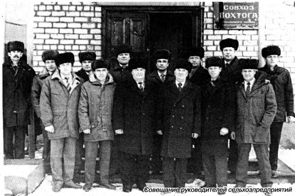
Совещание руководителей сельхозпредприятий