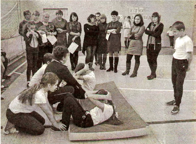
Структура комплекса ГТО предусматривает 58 испытаний

«С этими детьми мы тренировались в «Школе мяча», раз