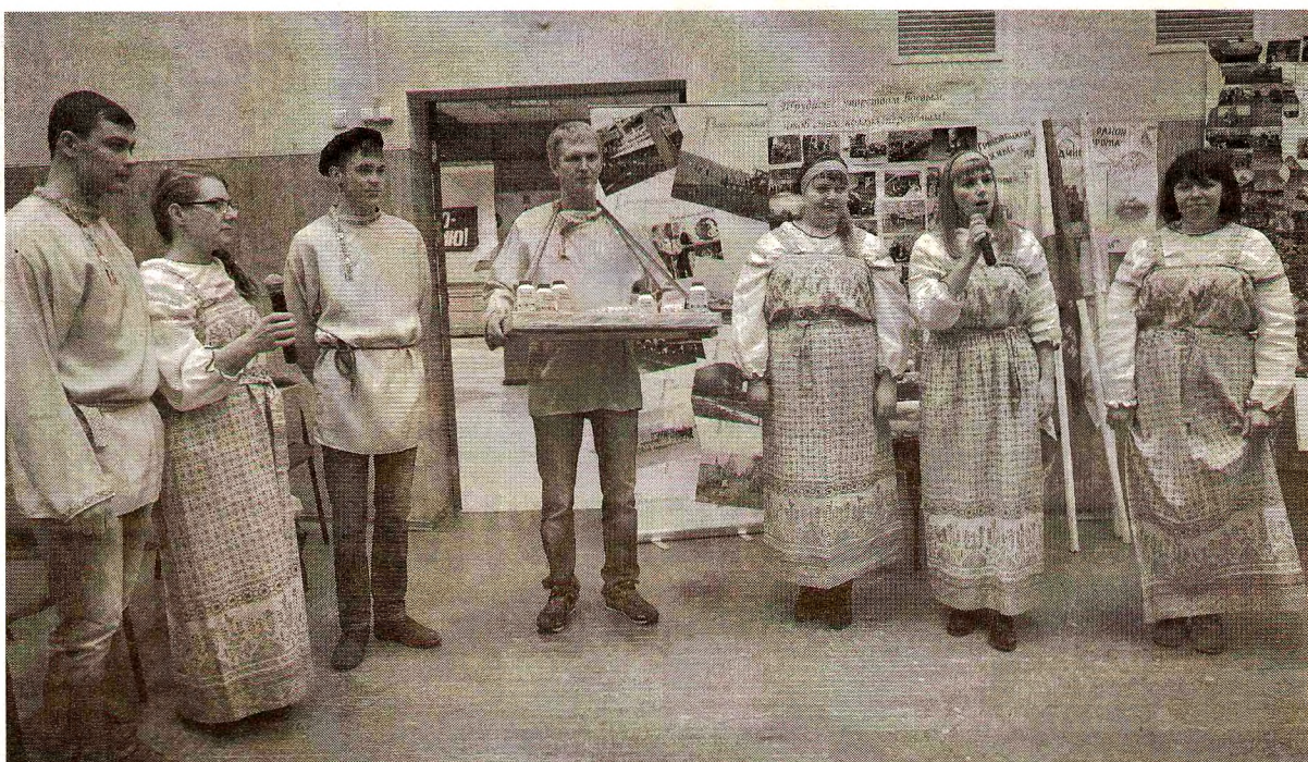
Грязовчане достойно представили район

В слете участвовали молодые специалисты в возрасте до 35 лет, работающие на предприятиях АПК. Это девять команд из районов области, в том числе и из Грязовецкого.