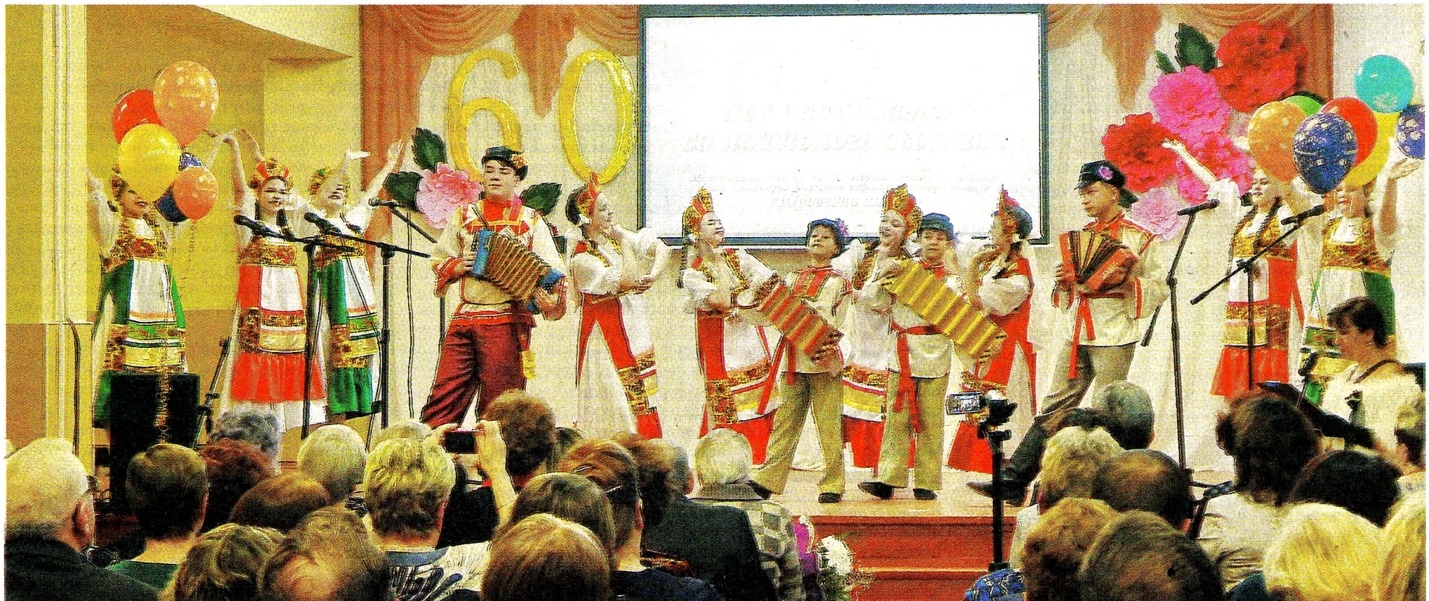
На сцене - «Ласточка»

Администрация МБОУ «Юровская школа»