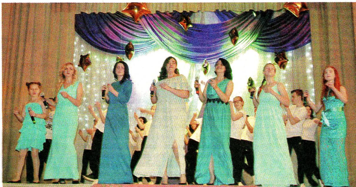
Праздничный концерт удался

Без всякого сомнения, праздничный концерт удался! Коллективу БУК «Вохтожский ПДК» хочется пожелать процветания и ещё долгих лет успешной деятельности. Пусть атмосфера творчества, которой наполнены стены Дома культуры, пробуждает в людях доброту и вдохновляет на созидание! Мы уважаем вашу работу, ценим ваше творчество, гордимся вашими достижениями!