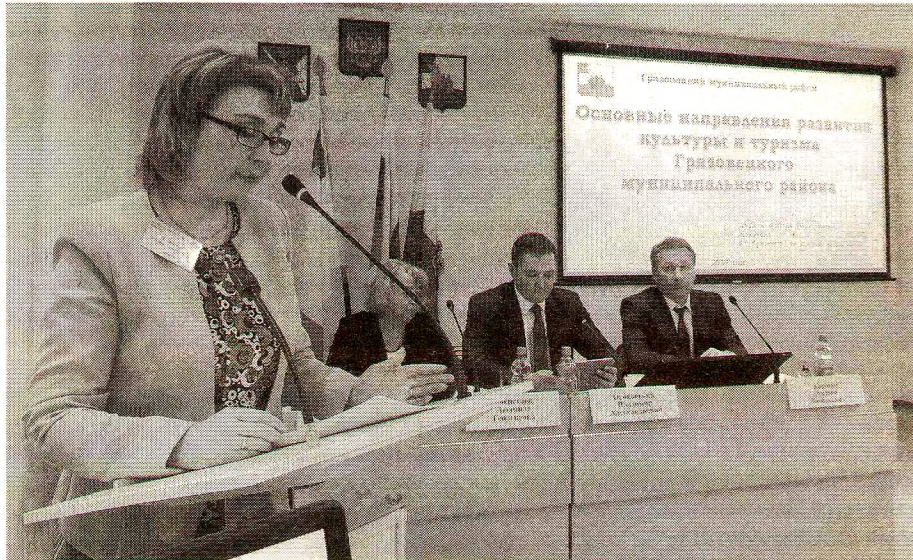
Выступление директора Комитета по культуре и туризму Ю. Д. Клименко

Выездное заседание расширенной коллегии Департамента культуры и туризма области «Актуальные проблемы в сферах культуры, туризма и архивного дела Вологодской области. Перспективы их решения» состоялось 28 ноября на территории Грязовецкого муниципального района.