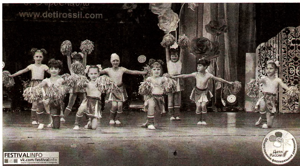
Юные гимнасты - лауреаты III степени в номинации «Эстрадный танец» Международного конкурса-фестиваля