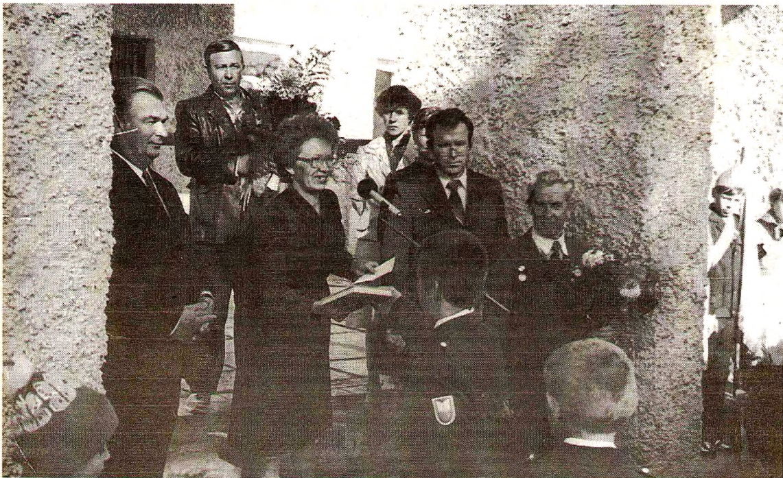
1 сентября 1987 года.