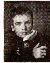
НАТАЛЬЯ МЕЛЁХИНА, ЖУРНАЛИСТ, ПРОЗАИК, КРИТИК