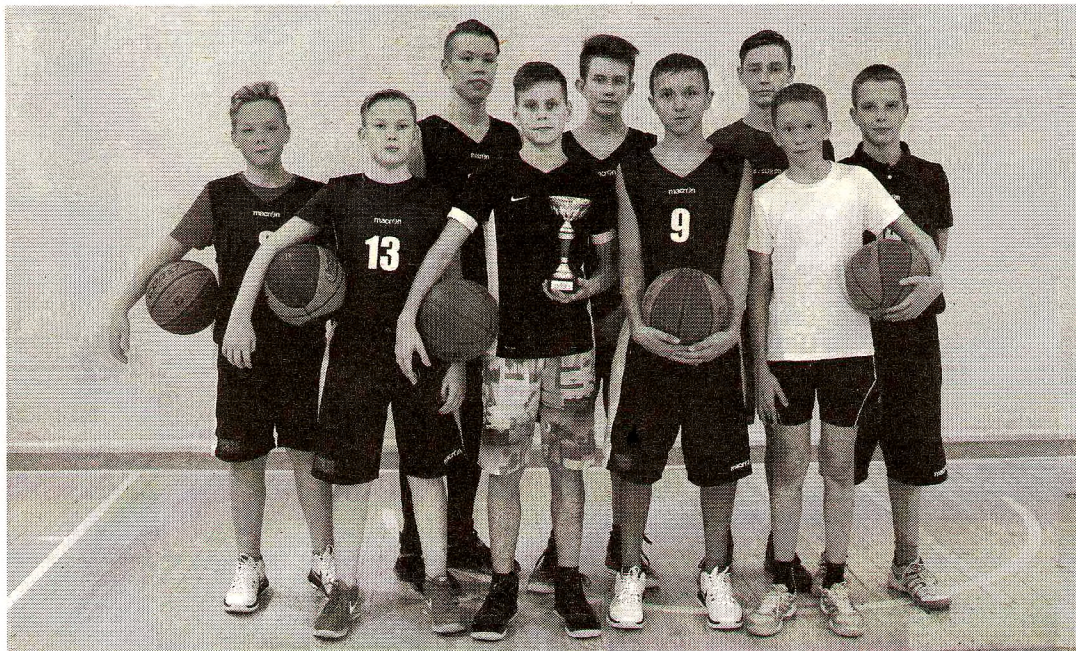
Юношеская сборная по баскетболу г. Грязовца