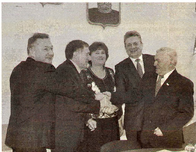
Районное трехстороннее Соглашение подписано

объема расходов в 2018 году по сравнению с 2017 годом является уменьшение объемов межбюджетных трансфертов из федерального и областного бюджета за счет изменения структуры субсидий и передаваемых полномочий от муниципальных образований. Снижение субсидии на переселение из ветхого и аварийного жилья к 2017 году составляет 65,7 млн рублей в связи с завершением программы в 2017 году.