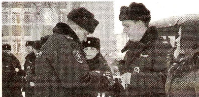
Проверка внешнего вида

Далее руководством полиции были проверены внешний вид сотрудников полиции, экипировка, наличие нагрудных знаков, жетонов и удостоверений. После чего личный состав заступил на охрану