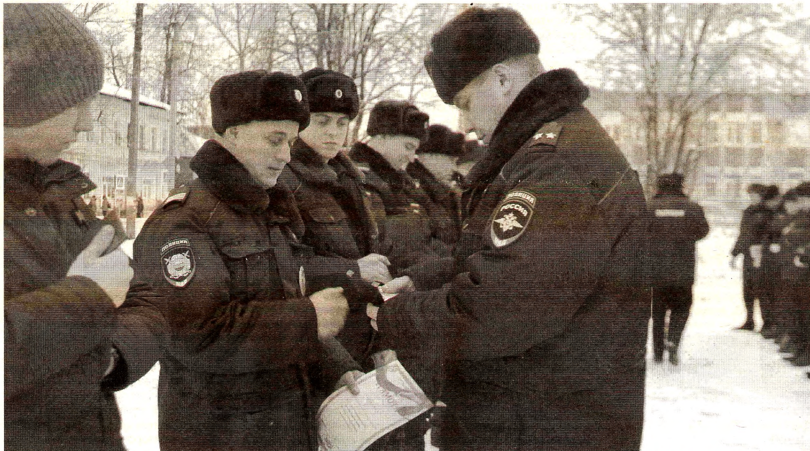
Вручение удостоверений и наград