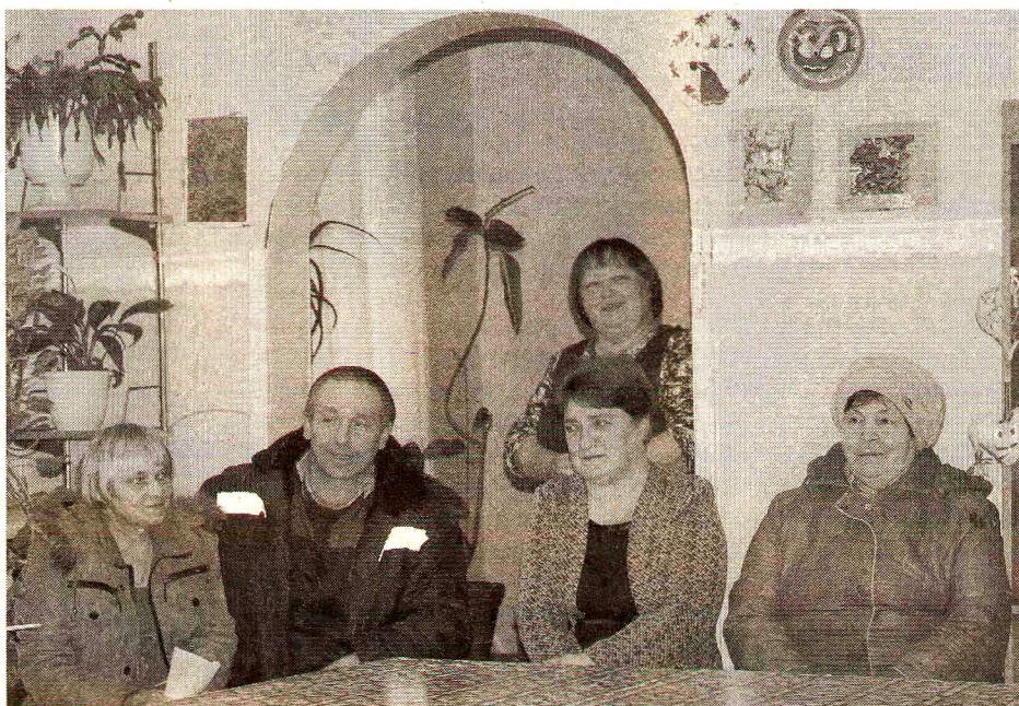
Д. Сидоровское. Встреча с читателями

Дорога Заемье-Тимонино находится в региональном подчинении. Планы ремонтов на год формирует Департамент дорожного хозяйства Вологодской области. В настоящее время администрация Грязовецкого муниципального района информацией о планах на ремонтные работы автомобильных дорог регионального значения, расположенных на территории Грязовецкого муниципального района, не располагает.