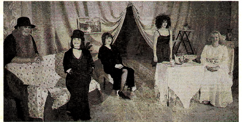
Спектакль «Дом моего сердца», Комьянский СДК