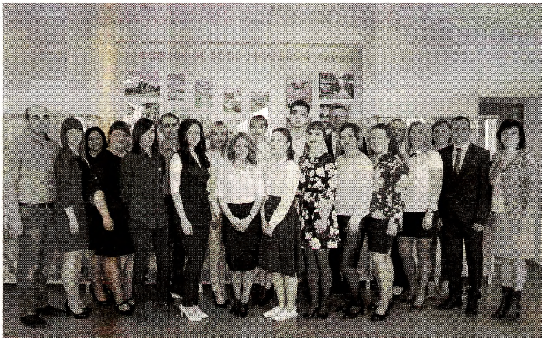
Третий состав Молодежного парламента

На встрече обсудили возможность создания дискуссионного клуба на базе Молодежного парламента. «Такая форма клубной деятельности развивается сейчас как в школах, так и в дошкольных учреждениях. Думаю, что она была бы актуальна и среди молодежи, - предположила начальник Управления образо-