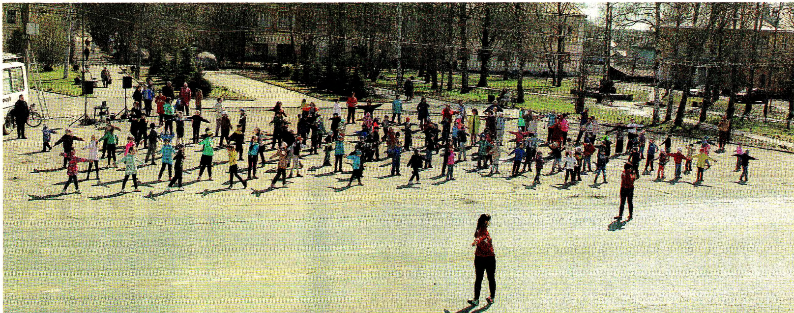
В мероприятии приняли участие более ста человек - активные ветераны, а также дети из школ и детских садов города

«Нас пригласили поучаствовать, и мы с удовольствием пришли, - пояснили воспитатели подготовительной группы Центра развития ребенка-детского сада № 1. - Наши ребята спортивные, активные, веселые. Вчера сдавали ГТО, сегодня танцуем! Скучать некогда!»