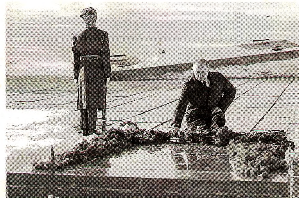
2 февраля в Волгограде прошли праздничные мероприятия в честь 75-летия Сталинградской битвы

Увидел глава государства и необычную мультимедийную экспозицию. На экранах - портреты солдат, останки которых были найдены поисковиками за последние несколько лет. Коснувшись рукой фотографии, можно будет узнать фронтовую историю каждого из тех, кто, защитив город на Волге, изменил ход мировой истории.