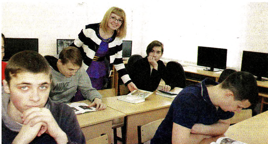
Сотрудничество техникума и предприятия набирает обороты

Филиал Грязовецкого политехнического техникума в поселке Вохтога открылся 1 сентября 1991 года на базе Вохтожского ДОКа. За время всей работы учебного заведения подготовлены сотни специалистов таких направлений как токарь, слесарь, слесарь КИПиА, электромонтер по ремонту и обслуживанию электрооборудования, мастер столярно-мебельного производства, продавец-кассир.