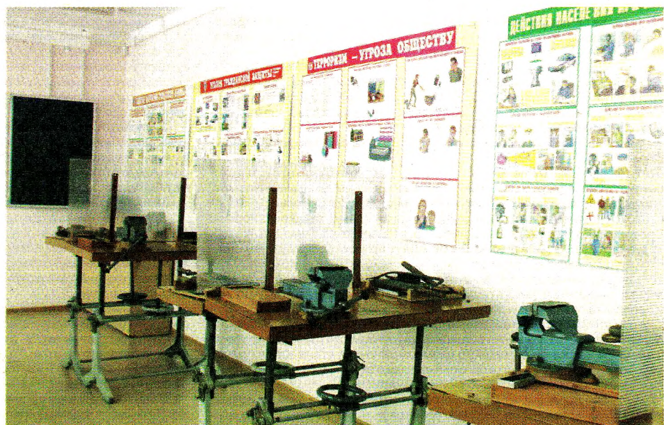
В учебной мастерской филиала