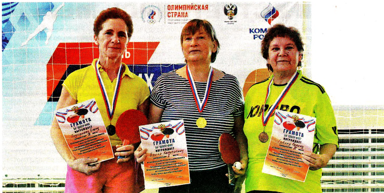
Призеры в личном первенстве

Приятно было слышать смех игроков команды Дома ветеранов. Хоть им игра давалась непросто, они крутили