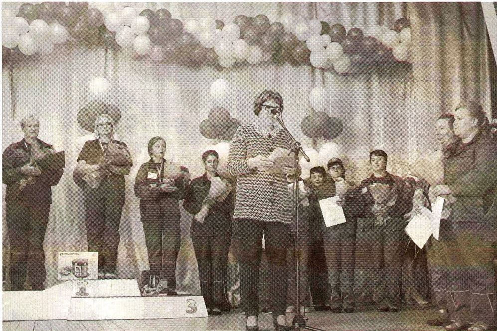
Награждение победителей. Фото газеты «Звезда», Шекснинский район

Специалисты, от которых зависит численность коров в области, боролись за звание лучшего в своей профессии в Шекснинском районе: это 23 оператора по искусственному осеменению коров из 20 районов Вологодской области.