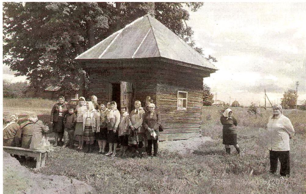
9 июля в обновлённой часовне прошёл молебен