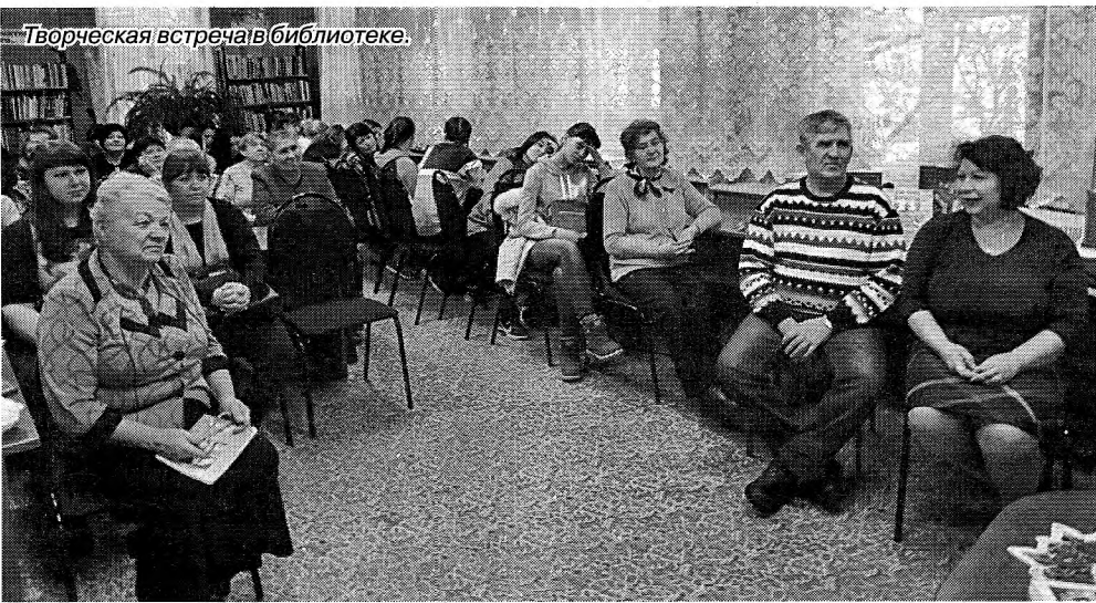
Творческая встреча в библиотеке.

Суть – экстремальная хиппи и крен не дольвшего судна, Буйство начала и гордое знание края. Щелканье шишек, ночная прямая угроза, Щелканье выстрелов – линий оборванных искры. Падать, так с музыкой – твой незатейливый лозунг, Падать салютом и праздником – немо и быстро. Глянью, и будто потянет курящийся тайною омут: Тают огни, растекаясь до молнии-ленты, Блеском смолы все они закипят и застнут, Это не мистика – истинно дышат живые моменты. Глянью – темно, только гулкою пропастью свыше Зрит молчаливое и беспощадное око, Тайною силою дерево чует и дышит, Властно оно надо мной тишиною глубокой. Ольга МАРКУШИНА