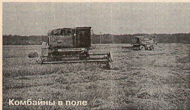
Комбайны в поле