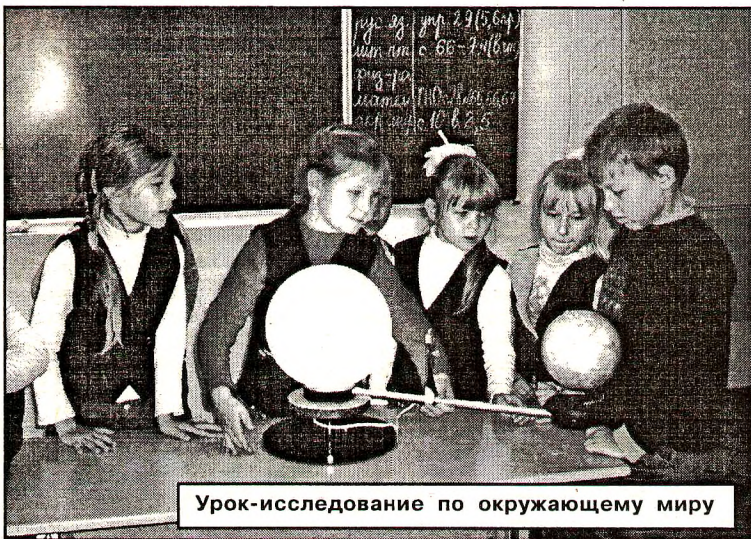
Урок-исследование по окружающему миру