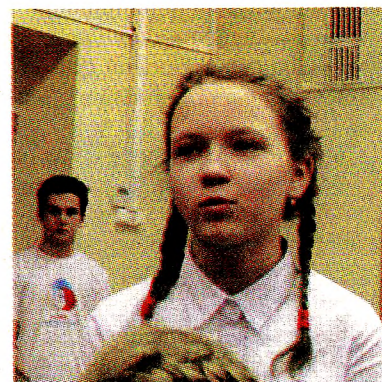
Детей интересовало всё: от зарплаты чемпионки до её личной жизни