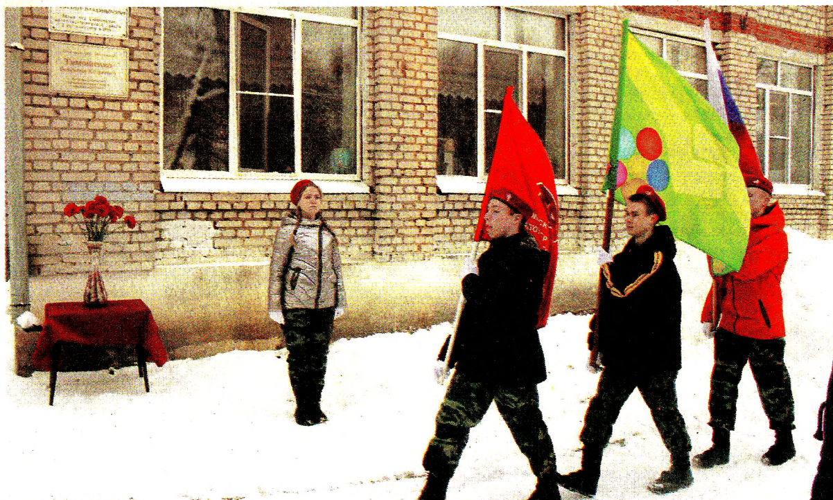
Открытие мемориальной доски на здании средней школы № 2 г. Грязовца, февраль 2019 год

По материалам, предоставленным сотрудниками библиотеки д. Скородумки, и книге «Пепел Афгана» подготовила Наталья НОСОВА