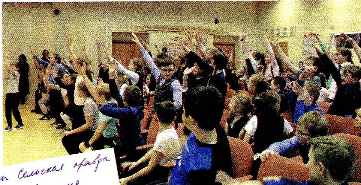
Вопрос хотел задать каждый