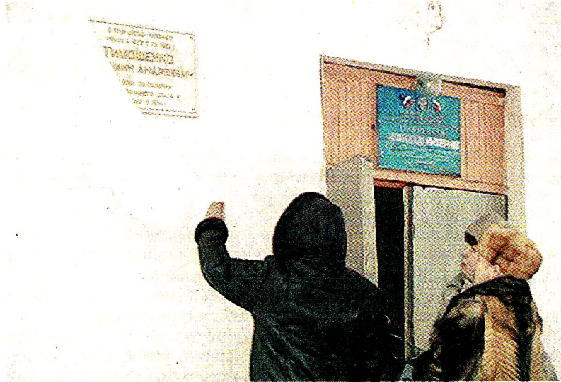
Открытие мемориальной доски на здании школы-интерната, декабрь 2001 год

Служба его проходила в основном по опорным пунктам, расположенным вдоль дороги. 2 декабря 1984 года он писал: «Сейчас мы стоим на охране дороги Термез-Кабул. От границы я нахожусь не очень далеко, всего 300-400 километров. Ты пишешь,