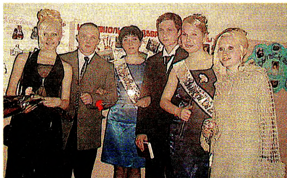
Фото из № 8 (913) от 5 февраля 2019 года