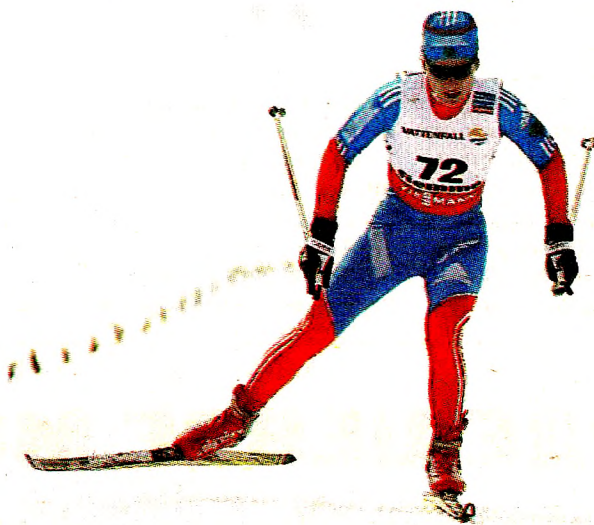
«Никогда в жизни не прибегала к запрещенным препаратам. Я за честный спорт»