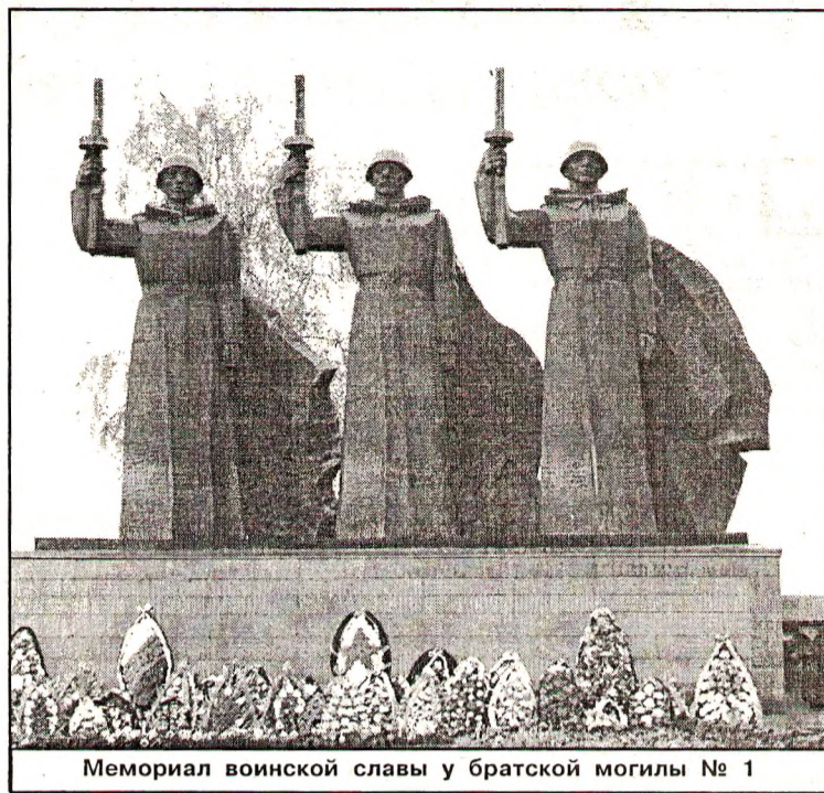
Мемориал воинской славы у братской могилы № 1

Ударная группировка 40-й армии, в которую входила и 100-я стрелковая дивизия, исчерпала свои возможности и перешла к обороне. Советские войска не только выполнили боевую задачу, но, и что главное, - добились своей цели. Они поднялись на высоты, овладели важным плацдармом в правобережной части города. Попытки противника вернуть потерянные на Чижовке позиции успеха не имели.