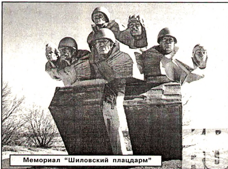
Мемориал «Шиловский плацдарм»

Материал подготовил Н. ГУСЕВ. (Окончание следует).