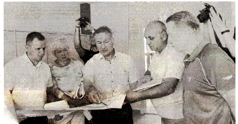
В рамках реализации первого этапа второй очереди ФОКа «Атлант» почти завершено строительство спортивных площадок, построена лыжная база

меняется система вентиляции, электропроводка, проводятся внутренние отделочные работы. По отоплению есть небольшая задержка порядка двух недель, подрядчик обещает завершить работы к середине июля. По второму контракту все работы идут по графику. Сегодня с нами работали представители районной ад-