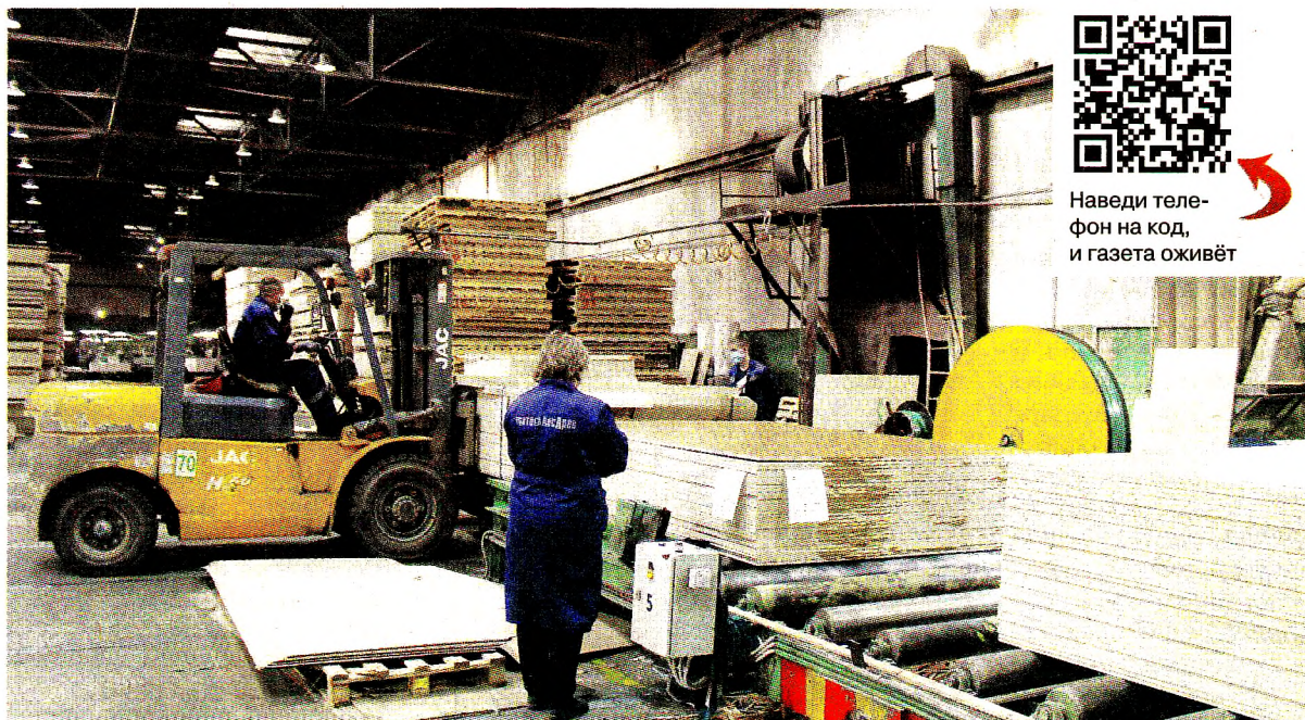
Упаковка готовой продукции

последние несколько лет на заводе была проведена индексация заработной платы, надеемся, что теперь сможем делать это регулярно. Все основные бюджетные показатели мы выполнили, поэтому остановка на период пандемии хоть и стала для предприятия неприятной неожиданностью, но не застала врасплох. По Указу Президента РФ в конце марта работа завода была приостановлена по 6 апреля. Потом две недели отработали, заполнили полностью склады и снова встали, но уже по причине того, что все наши контрагенты ушли на карантин и не работали. Соответственно, завод был готов производить плиту, продукция в наличии, а отгружать её некому, заказы не поступают. Все наши производственные цепочки остановились. Однако я помню времена и похуже, когда плиту не продавали, а просто меняли на другой товар, то есть товарно-денежные отношения отсутствовали вообще, но завод всё равно выжил. А выжил потому, что не опускал руки, не уповал на то, что кто-то придёт и что-то сделает, а просто каждый выполнял свою работу, искал для себя варианты повышения эффективности на каждом рабочем месте. Вот и в этот раз мы быстро сориентировались и подстроились под ситуацию: сдвинули сроки