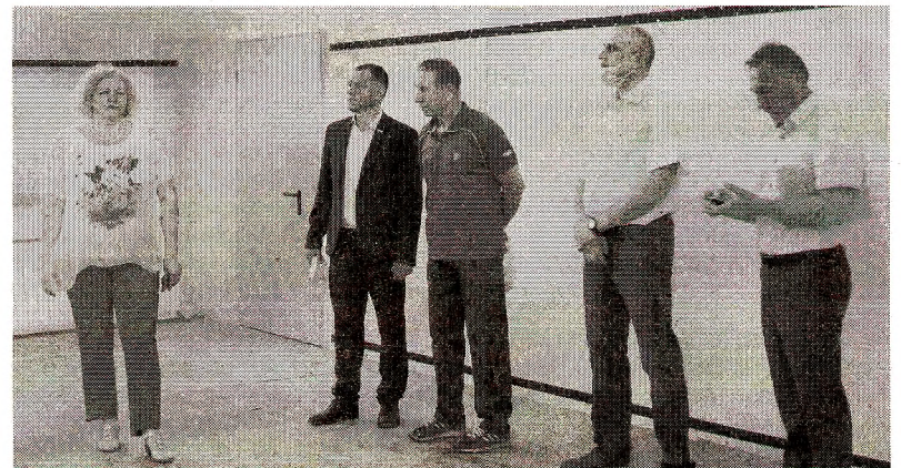
В 2020 году необходимо отремонтировать системы отопления и вентиляции, фасад, а также провести косметический ремонт в трёхэтажной части здания средней школы № 2 г. Грязовца