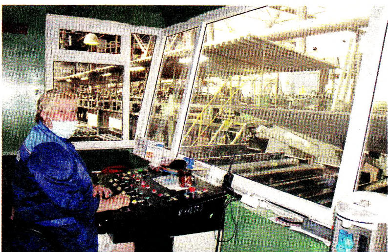
Операторская линия отделки цеха ДСП