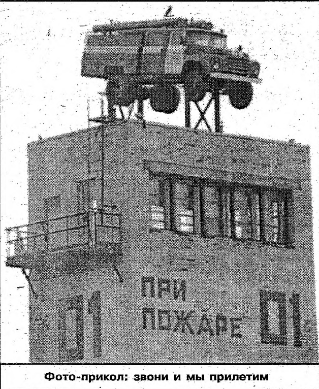
Фото-прикол: звони и мы прилетим

учеными из Калифорнийского университета, но «российские специалисты пошли еще дальше, усилив формулу препарата, что привело к увеличению продолжительности жизни экспериментальных животных и уменьшению их массы». ИБМЕД начал клинические испытания нового омолаживающего препарата, сообщил он.