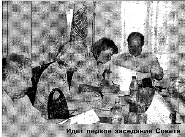
Идет первое заседание Совета

В связи с созданием с 1 января текущего года территориального органа управления МЧС России - Главного управления МЧС России по Вологодской области - на территории области сформированы федеральная и областная группировки сил и средств государственной противопожарной службы. Начиная с этого года, планируется поэтапно сформировать противопожарную службу области, органом управления которой будет являться орган исполнительной государственной власти - управление гражданской защиты и пожарной безопасности области.