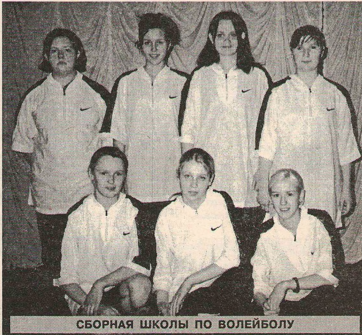
СБОРНАЯ ШКОЛЫ ПО ВОЛЕЙБОЛУ