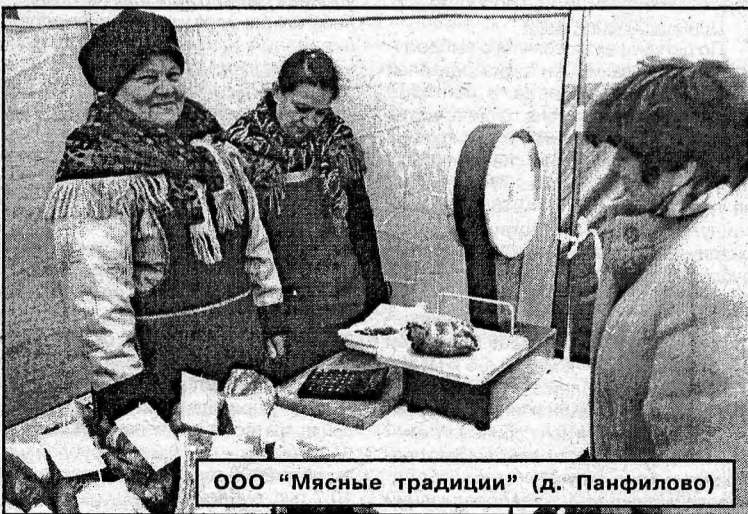
ООО «Мясные традиции» (д. Панфилово)