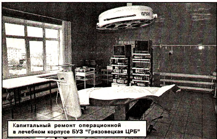
Капитальный ремонт операционной в лечебном корпусе БУЗ «Грязовецкая ЦРБ»