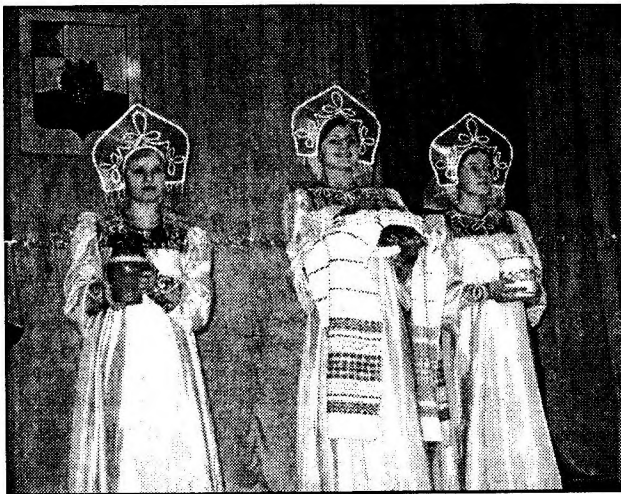
Хлеб да соль гостям праздника

Наград было очень много, в следующих номерах газеты мы назовем все фамилии передовиков, расскажем об их успехах.