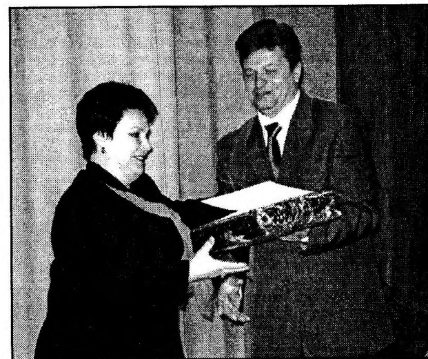
Награды - лучшим по профессии