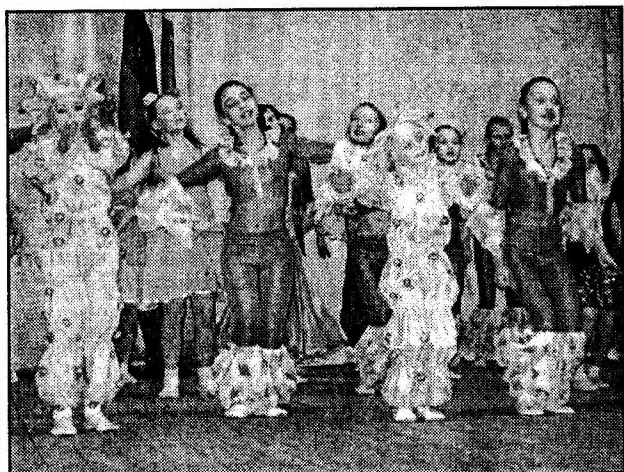
Танец - в подарок