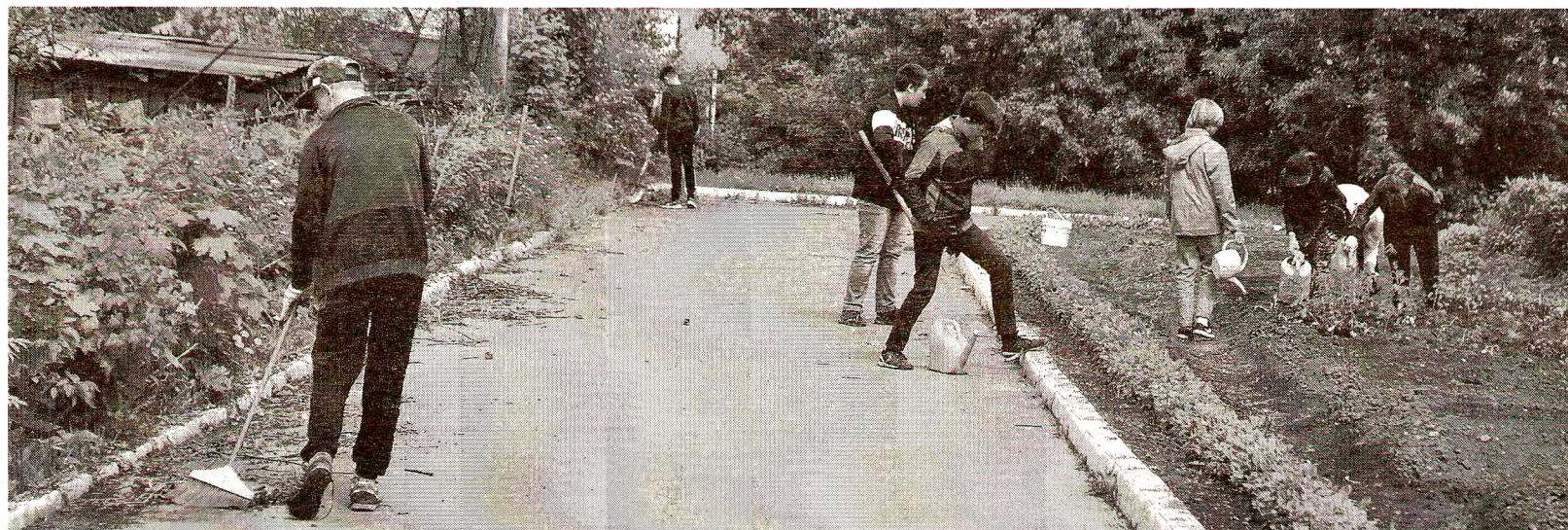
Основные рабочие места для трудоустройства несовершеннолетних созданы в бюджетных учреждениях района