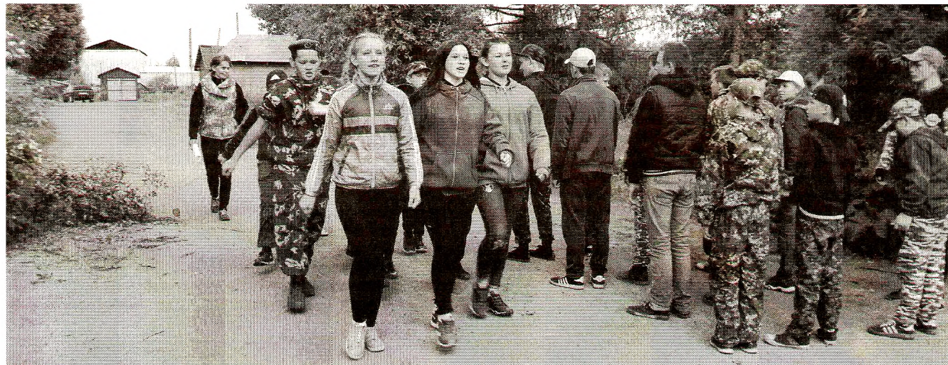
Среди участников сборов - 14 девочек