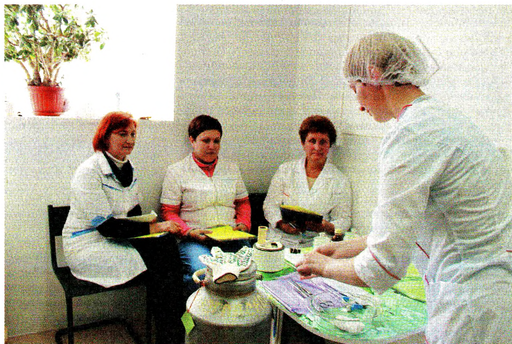
Один из этапов - работа в лаборатории