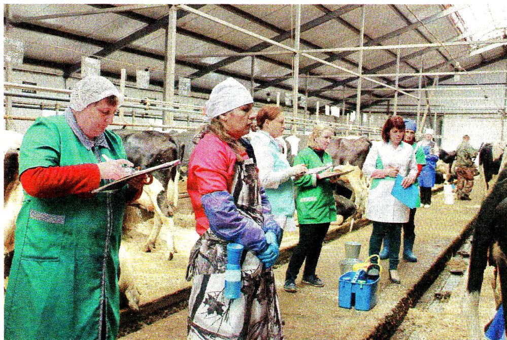
В доильном зале. Жюри оценило мастерство операторов машинного доения

Традиционный конкурс мастерства среди работников сельского хозяйства «Лучший по профессии» состоялся на прошлой неделе на базе ООО «Покровское». Участниками стали представители восьми сельхозхозпредприятий Грязовецкого и Междуреченского районов и студенты Грязовецкого политехнического техникума.