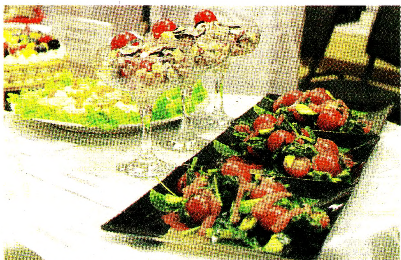
Столы ломались от выпечки и закусок