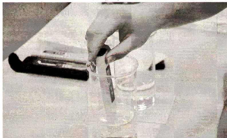
Современное оборудование позволяет заниматься генной инженерией и биотехнологиями

Оборудование в мастерской «Генная инженерия» будет использоваться в реализации программ по специальностям «Агрономия», «Ветеринария», «Технология производства и переработки сельскохозяйственной продукции» и «Эксплуатация и ремонт сельскохозяйственных машин и оборудования». Студенты будут выводить гены из клетки организма и внедрять их в другие организмы. В результате ребята выведут растения, устойчивые к вредителям, болезням и неблагоприятным условиям. Соответ-