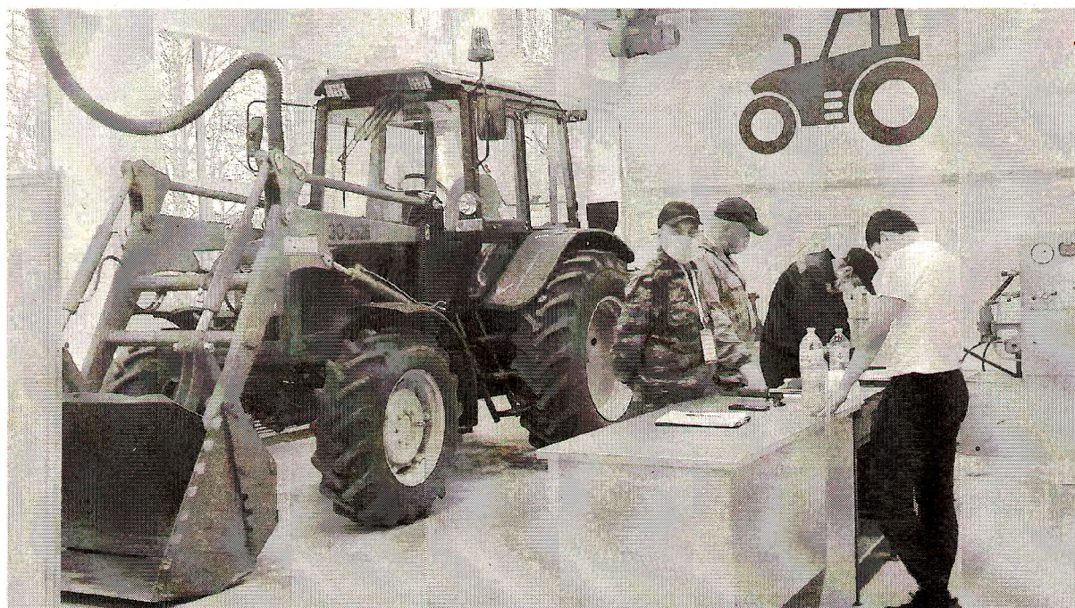
На площадке «Эксплуатация сельскохозяйственных машин» в шестой раз прошёл региональный Чемпионат «Молодые профессионалы» Ворлдскиллс

ственно, аграриям понадобится меньше химических веществ для обработки полей.