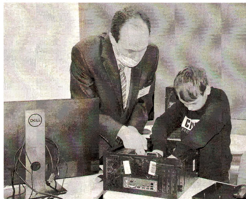
Азам программирования обучаются 400 школьников

Подписание соглашения о сотрудничестве с Мобильным кванториумом, который является структурным подразделением череповецкого кванториума, открывает новые возможности и для Цифрового центра, и для юных грязовчан. На базе мобильного