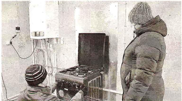
Два абонента уже подключили газ