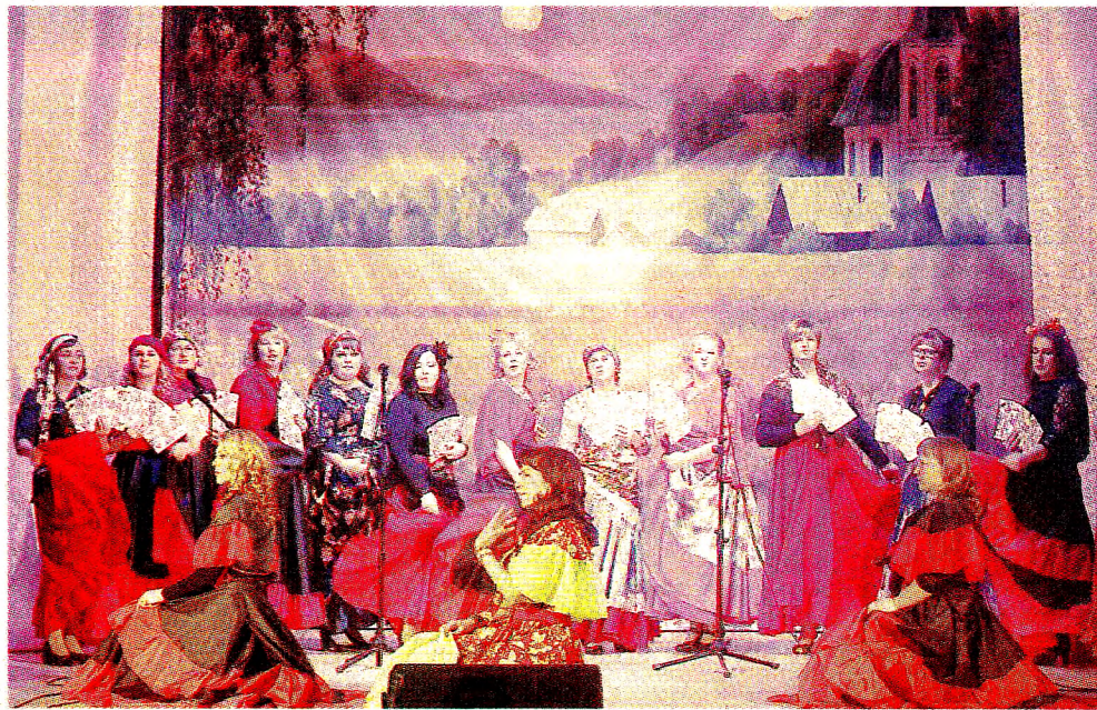
Хор племзавода-колхоза «Аврора»