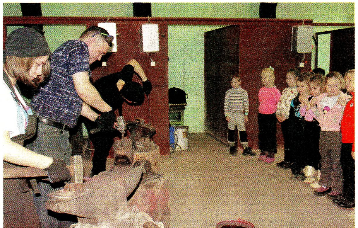
Мастер-класс «Кузнечное дело»