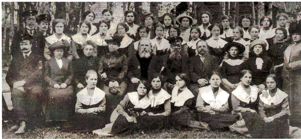
Попечительский Совет женской гимназии и гимназистки. К 1915 году количество городских и приходских учебных заведений выросло в разы

С последней трети XIX века в уезде начинает бурно развиваться маслоделие, особенно с открытием железной дороги в 1872 году. Земство не стоит в стороне от важных дел, относящихся к маслодельной промышленности - ведет строгий учет маслоделен и их санитарного состояния, помогает внедрять новые технологии и передовой опыт зарубежных фирм. При такой поддержке грязовчане добиваются высоких результатов. Например, в 1889 году в Санкт-Петербурге на Всероссийской выставке молочного хозяйства Грязовецкий уезд был признан одним из лучших не только в губернии, но и во всем Северном крае. Не осталось в стороне от Земства и развитие сельского хозяйства, для чего всячески распространялись сельскохозяйственные знания, пропагандировался передовой опыт, устраивались сельскохозяйственные