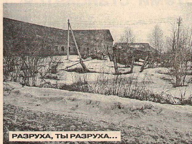
РАЗРУХА, ТЫ РАЗРУХА...