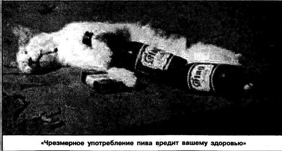
«Чрезмерное употребление пива вредит вашему здоровью»

«Жанр фильма я бы определил как «попсовые фантазии», основанные на песнях данной звезды, - рассказывает Эдуард Ханок. - Например, на станции Леонтьевская слобода Гламурчик встречается с Леонтьевым-пенсионером - ведь певец в одной из своих песен объявил о том, что уходит со сцены. Или будет снята медвежонок сон про суд над Газмановым, чьи песни не вписывались бы в советскую действительность. Но этот суд носит «юморной» характер. В мультфильме не будет никакого оплевывания артистов».