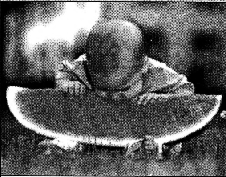
Ну, арбуз, погоди!

Дочь датского короля Кристиана и королевы Луизы родилась в 1847 году. В счастливом браке с Александром III она стала матерью шести детей. Покинув вторую родину после революции, Мария Федоровна скончалась в 1928 году и была похоронена вблизи Копенгагена.