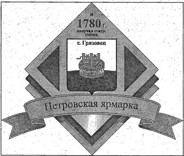
Так выглядит логотип Петровской ярмарки

В районе ведутся активные организационные работы