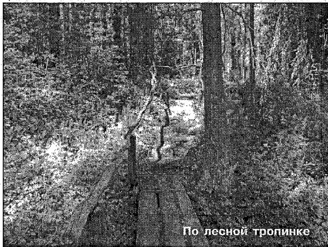
По лесной тропинке

Одной из неотложных задач летнего периода текущего года будет подготовка и празднование 225-летней годовщины со дня рождения города Грязовца и проведение V Петровской межрегиональной ярмарки товаров народного потребления. Особое внимание в это время будет уделено ремонту зданий и сооруже-