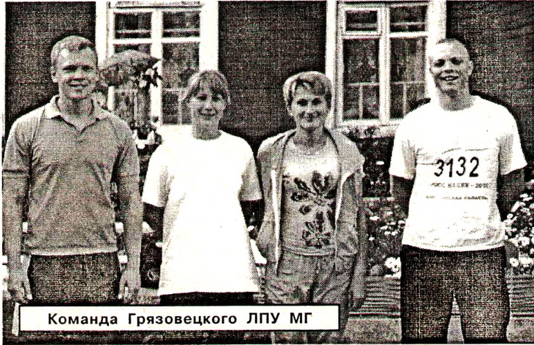
Команда Грязовецкого ЛПУ МГ

В этот же день, вечером, на стадионе приветствовали рабочую молодежь. Спортивное мероприятие прошло под девизом: «Спортивная молодежь - здоровое поколение». Помериться силами в дартсе и туристической полосе препятствий вышли четыре команды: МО Ростилловское, Грязовецкой спе-