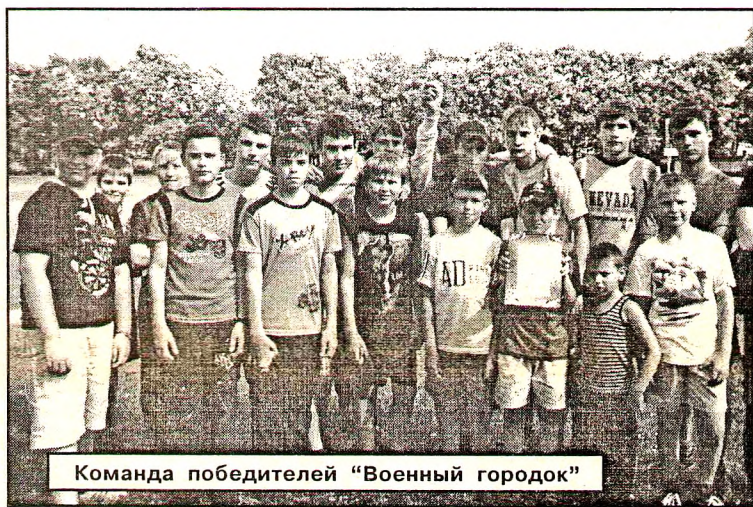
Команда победителей «Военный городок»