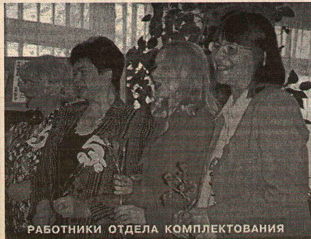
РАБОТНИКИ ОТДЕЛА КОМПЛЕКТОВАНИЯ