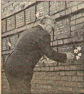
На снимках: ветераны; дань памяти; праздничная эстафета,