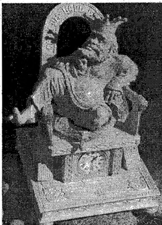
Царь Берендей - персонаж популярный до сих пор и иногда украшает, например, часы.

веках кочевавшее в степях вблизи от южных границ русских княжеств. Как Русь, так и берендеи страдали от набегов других кочевников - половцев, поэтому русские князья наняли берендеев к себе «на службу» и поселили их на приграничных землях с тем чтобы те охраняли русские княжества от половцев. Часть