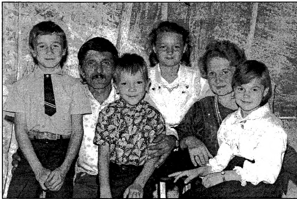
Фото из семейного альбома.