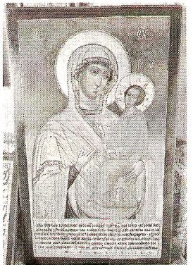
Икона Богородицы до и после реставрации