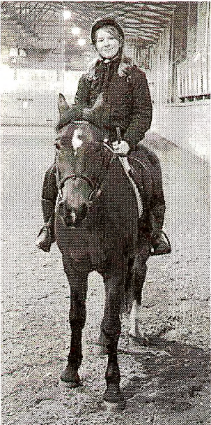
На Легионе я чувствую себя уверенно, потому что он не из пугливых

Верховая езда - полноценный вид спорта с огромной историей, причем входящий в категорию олимпийских видов спорта. И именно верховой езде все возрасты покорны, так как это не только вид прекрасного времяпрепровождения, но и отличное лекарство от множества болезней. Катание на лошадях способно заменить полноценное занятие в тренажерном зале, при этом от него вы получите не только физическое здоровье, но и массу положительных эмоций. Недаром верховую езду называют искусством свободного равновесия. А в результате продолжительных занятий можно обеспечить себя правильной осанкой и достаточно сильной мускулатурой.