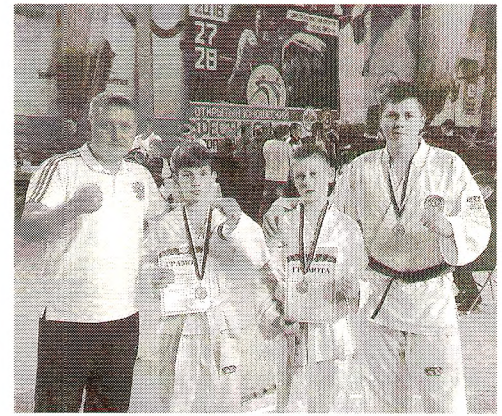
Вологодскую область представляли спортсмены Школы Тхэквондо Березина

27-28 октября в Архангельске состоялся открытый юношеский фестиваль спортивных единоборств, участие в котором приняли 800 спортсменов из разных регионов России. Спортсмены боролись за звания лучших в таких видах как Тхэквондо ГТФ, ИТФ, ВТФ, Кудо, Кобудо, Дзюдо, Тайский бокс, греко-римская борьба и других.