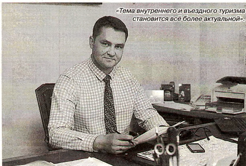
«Тема внутреннего и въездного туризма становится всё более актуальной».