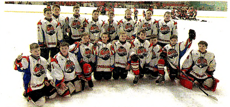
Команда хоккеистов 2006-2007 г. р.

В соревнованиях приняли участие пять семей