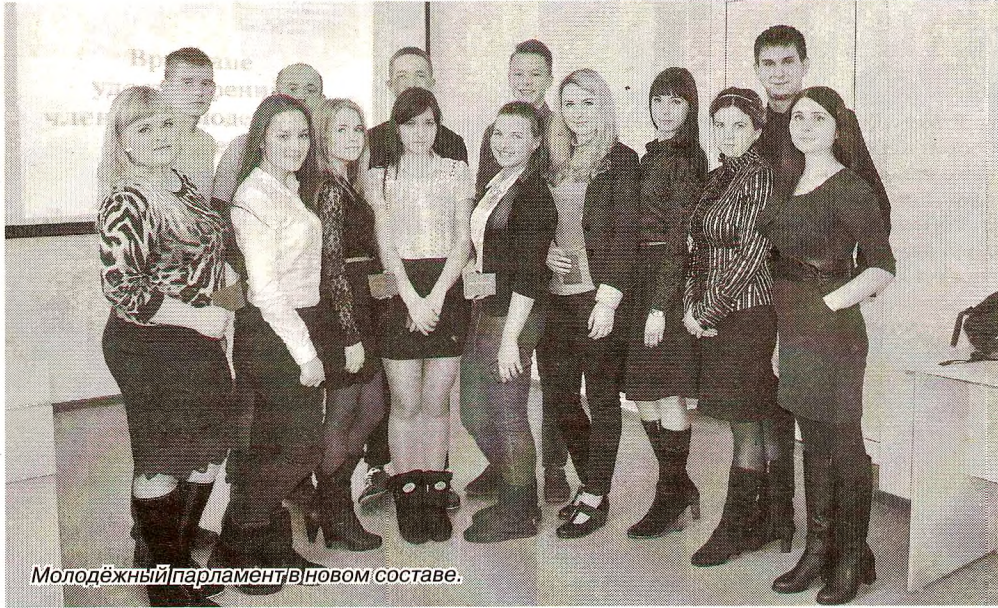
Молодежный парламентарий в новом составе.