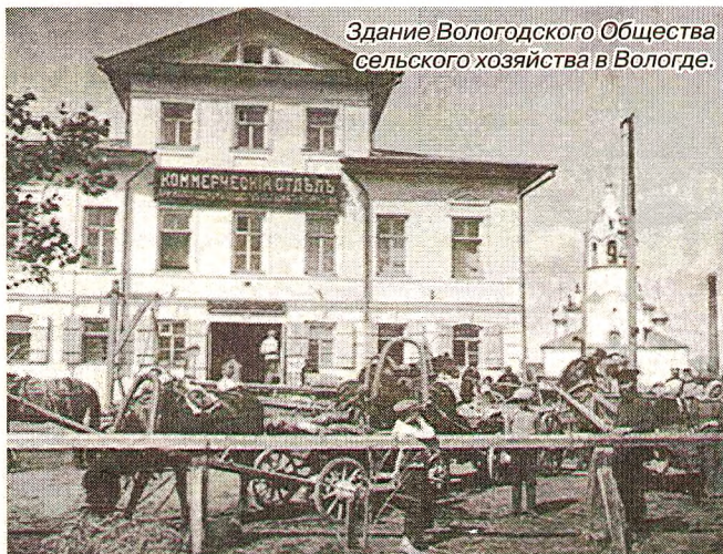
Здание Вологодского Общества сельского хозяйства в Вологде.

Мясное и молочное животноводство всегда было основой северных хозяйств, но в 1916 году наметилась опасная тенденция уменьшения численности крупного рогатого скота в крестьянских хозяйствах. Земцы отмечали, что если в конце 1915 года "крестьянин крепко держался за корову и неохотно уступал ее