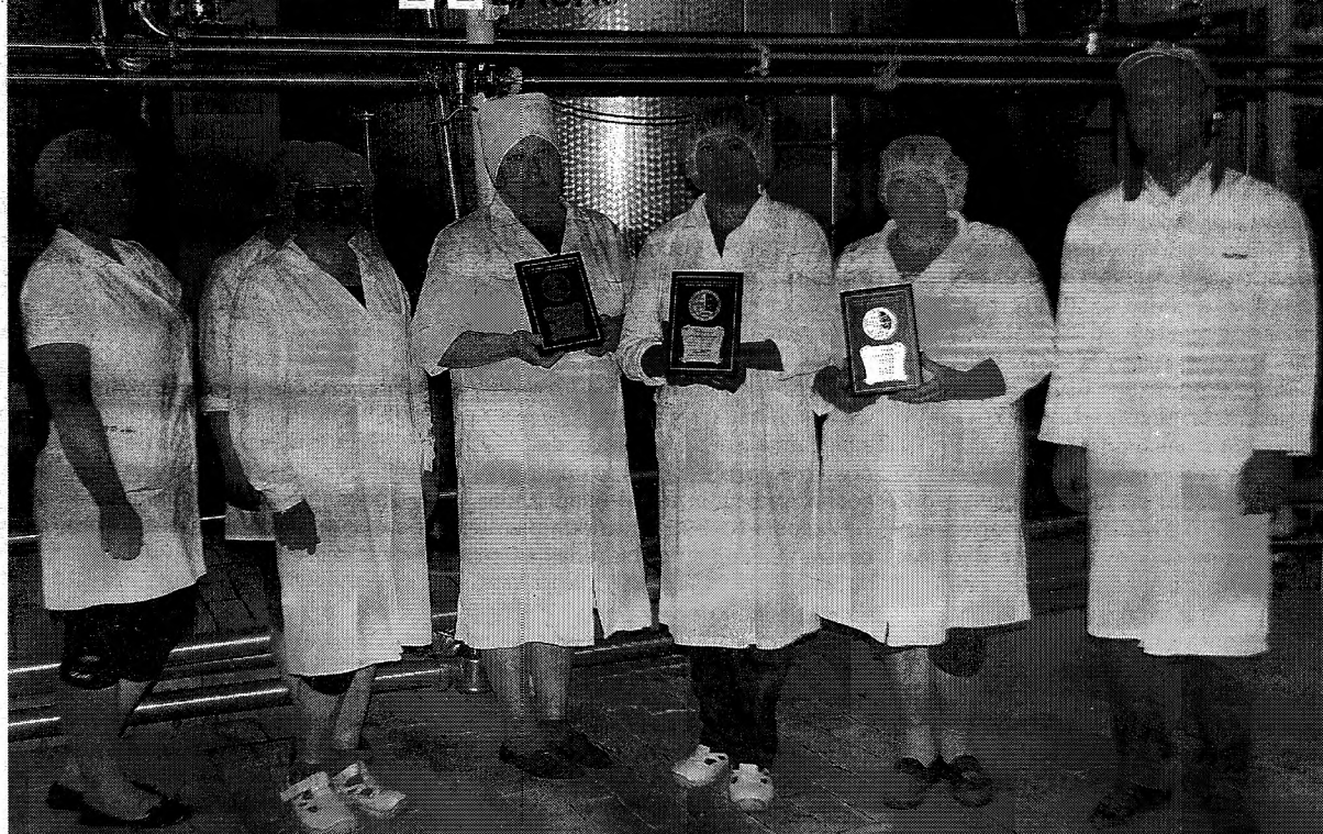
Качество грязовецкого масла в очередной раз подтверждено медалями российского смотра-конкурса.

В рамках Международной недели маслоделия и сыроделия с 15 по 21 июня проходил один из самых престижных российских смотров-конкурсов качества молочной продукции «Молочная гордость России» при поддержке Россельхозакадемии и Министерства сельского хозяйства РФ.