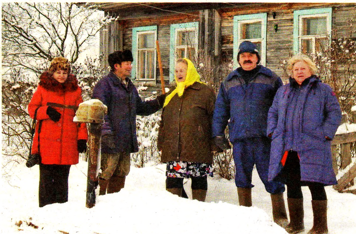
Деревня Савкино, декабрь 2015 года.

Александр, 25 лет: «Нравятся материалы про жителей нашего района, а именно про то, как они прославляют нашу Родину. С удовольствием читаю статьи о мероприятиях, где не сумел лично побывать, а также про спорт и наших спорт-сменов. Хотелось бы видеть статьи про все мероприятия (крупные и не очень) и события, которые произошли за неделю в