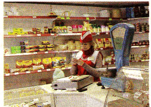
Магазин входит в социально-технологический заказ Северной железной дороги.