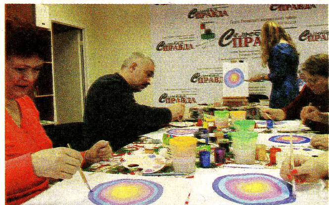
Рисование стало настоящей арт-терапией.