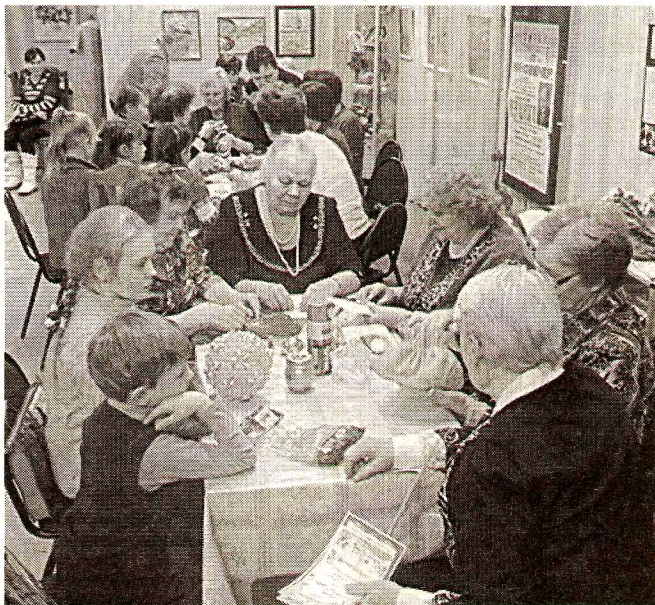
Каждый смог научиться той или иной технике рукоделия.

Стоит особо подчеркнуть, что члены Общества проявляют незаурядную активность во многих сферах творческой деятельности. В этом году впервые они участвовали в фотоконкурсе «Низкий поклон Землематуске», представив на суд жюри более 80 работ. Конечно же, и здесь оказались свои победители,