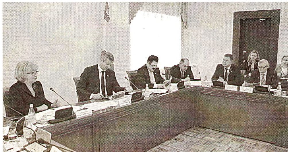
Центральным вопросом совещания стало обсуждение основных подходов к формированию местных бюджетов на трехлетний период.