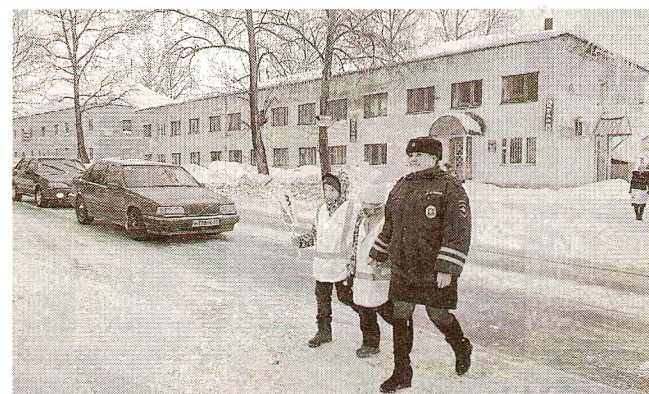
«Лайк» - поднятый вверх большой палец - термин, пришедший к нам из социальных сетей.