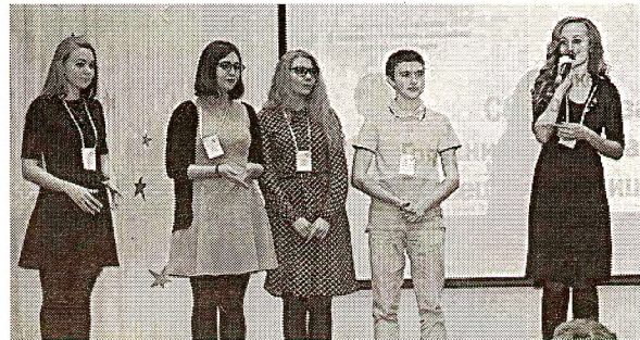
Представители школ района должны были презентовать себя и представить жюри модель ШУС.

Сбор актива органов ученического самоуправления Грязовецкого района впервые был проведен в 2016 году. Именно тогда было принято решение сделать подобную встречу традиционной.