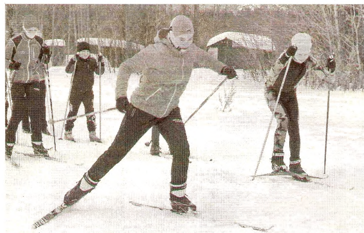
В гонке приняли участие 35 человек в возрасте от 6 до 60 лет.