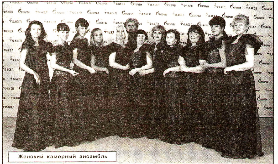
Женский камерный ансамбль