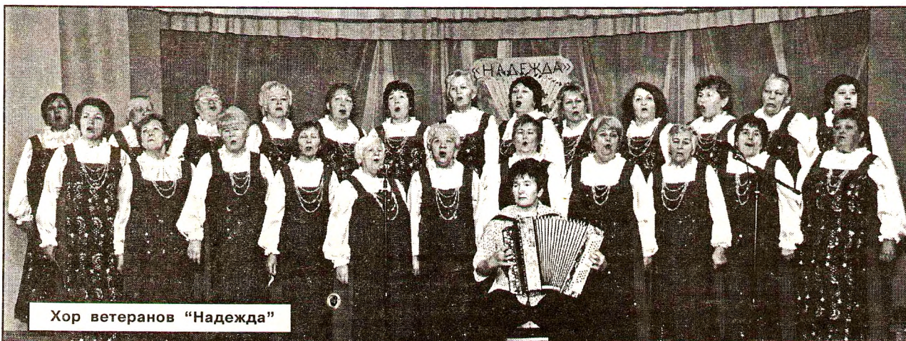
Хор ветеранов «Надежда»