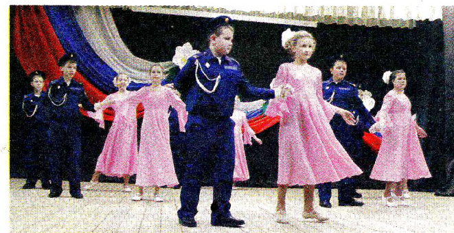
Кадеты Слободской школы