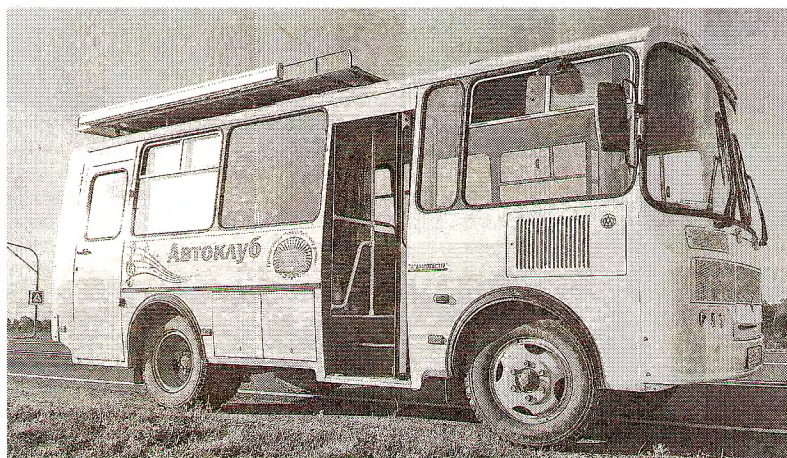
Уютный комфортабельный мобильный комплекс колесит по району, привозя людям хорошее настроение