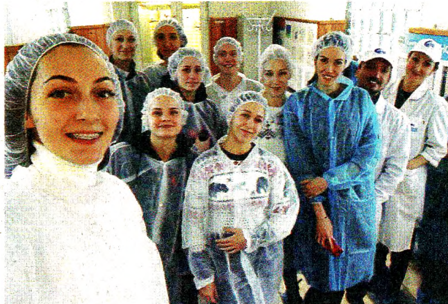
Сэлфи на память

Палисад», «Северное Молоко», «Comella», «Тысяча Озёр». Ассортимент молочной продукции формируется с упором на продукты с коротким сроком хранения из натурального сырья, которые приготовлены по традиционным технологиям и рецептурам, а также на расширение линейки продуктов с пониженным содержанием жира. Особое внимание уделяется выпуску продукции в более технологичной упаковке. Работа по обновлению ассортимента ведется