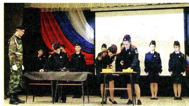
Кадеты Юровской школы