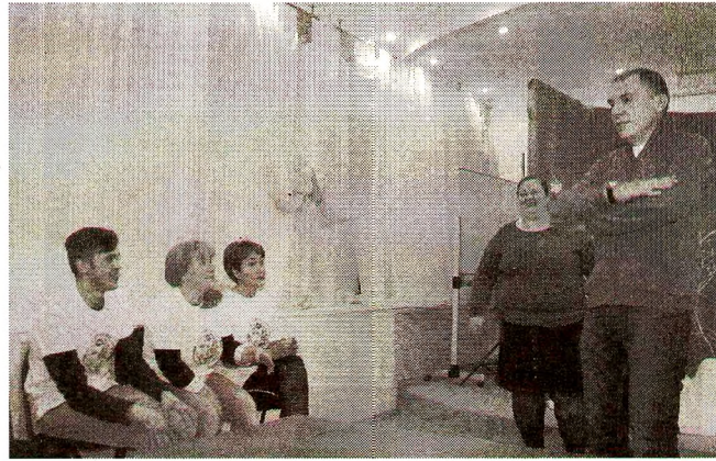
Игроки угадали большую часть из предложенных заданий