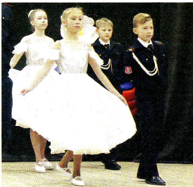
Кадеты Вохтожской школы