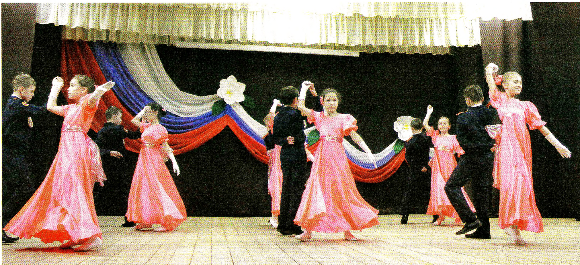
Кадеты средней школы № 2 г. Грязовца