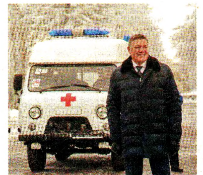
стр. 2, 3