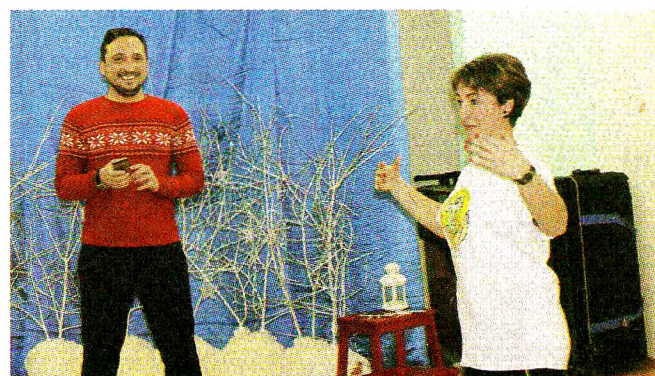
Каждый из участников стал мастером пантомимы