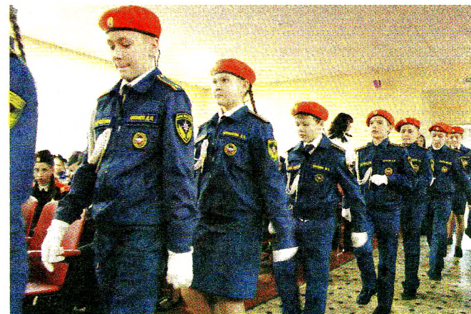
Кадеты средней школы № 1 г. Грязовца