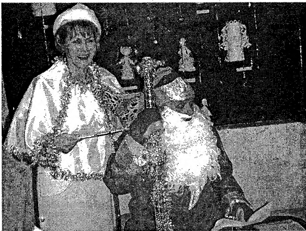
На снимке: вечер не был бы таким веселым без Деда Мороза и Снегурочки.